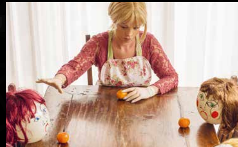
Abbildung (Ausschnitt): Julie Batteux, o.T., 2019, Fotografie

Beitrag: MAMA – Von Studierenden der Klasse Felten/Girst an der Akademie der Bildenden Künste Nürnberg ■